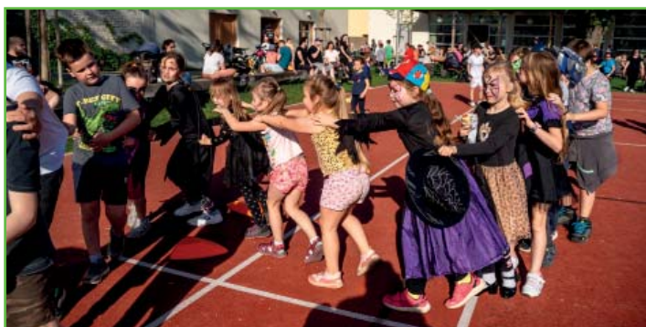
Pálení čerodějnic