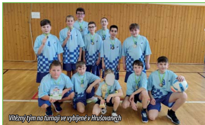
Vítězný tým na turnaji ve vybíjené v Hrušovaněch

Děti, které navštěvují náš kroužek vybíjené, už netrpělivě čekaly, které z nich budou vybrány, aby mohly naši školu reprezentovat. Musím říct, že i letos jsou děti velmi, velmi šikovné a bylo z čeho vybírat. Pro pátáky byl náš školní turnaj posledním, takže je to pro ně velká výzva a také prestiž se ho zúčast-