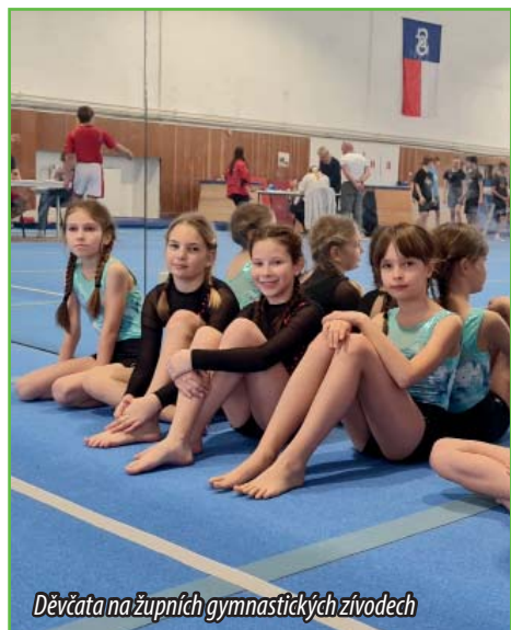
Děvčata na župních gymnastických závodech