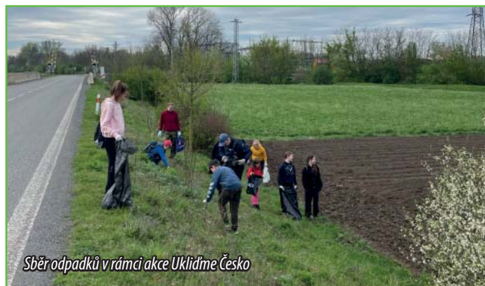
Sběr odpadků v rámci akce Uklidme Česko

V sobotu 6. dubna jsme v rámci celorepublikové akce Uklidme Česko vyrazili do terénu i my. Po srazu u klubovny jsme přešli na konec ulice Vodní, kde začíná náš tradiční rajón. Kolem staré části obchvatu není nouze o obaly od nápojů a jídel, a tak se naše pytle i popelnice na doprovodném traktúru od obce rychle plnily. U ramp jsme spolkli horalku a pár doušků sodovky a pokračovali v úklidu kolem stezky do Židlochovic. Skladba odpadků je tu jiná a převládají obaly od sladkostí, které tu ledabylí chodci pohazují. Po delší době nám vyšlo na sběr hezké počasí, a tak nám šla práce rychle od ruky. Už před obědem jsme seděli u ohně za klubovnou a odměňovali se nejedním dobře propečeným buřtem.