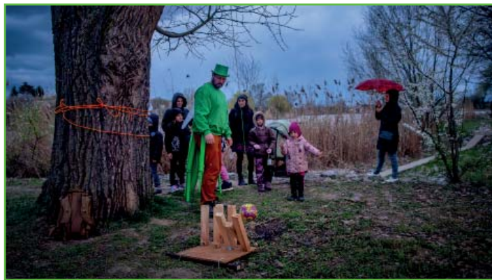
Louka plná broučků (Josef Valoušek)