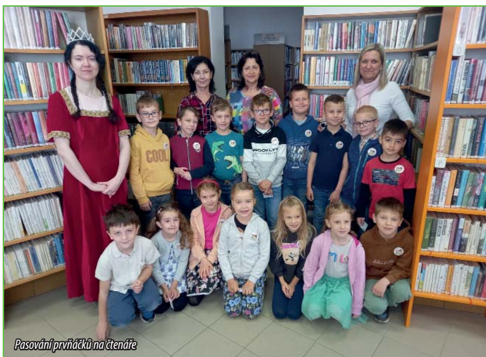
Pasování prvňáčků na čtenáře

Závěrem nechybělo ani společné foto na památku.