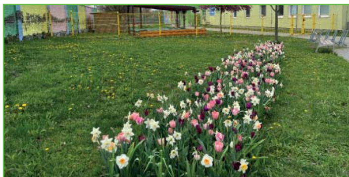
Nové květinové záhony před MŠ Jízdárenská