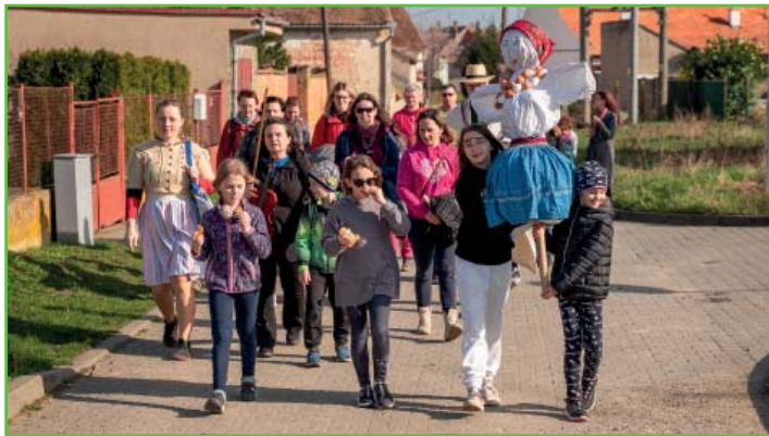
Vynášení smrtholky