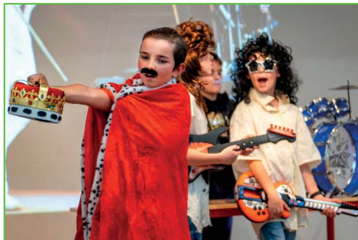
Rapsodie po česku - představení dětí ze ZŠ