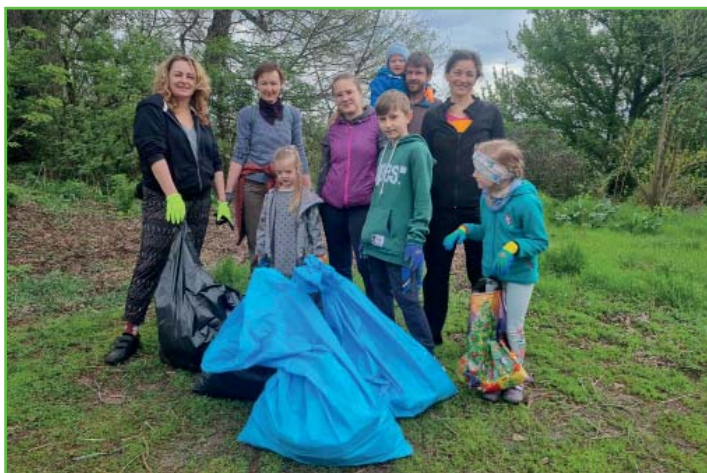
Dobrovolníci při akci Uklidíme Česko