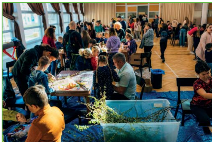
Velikonoční dílničky