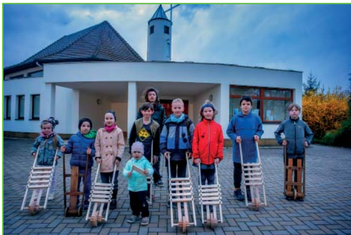
Hrkání o Velikonocích