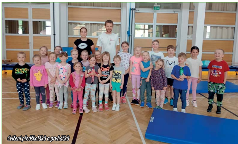
Čivení předškoláků a prvňáčků