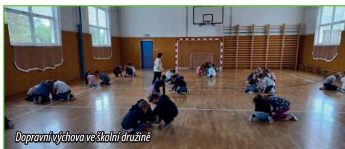
Dopravní výchova ve školní družině

Duben je považován za měsíc bezpečnosti. Na to jsme nezapomněli ani ve školní družině. Paní vychovatelky připravily pro děti kvíz z dopravní výchovy. V tělocvičně nachystaly různá stanoviště, na každém byla připravena kartička s otázkou. Děti se rozdělily do skupin, druháci