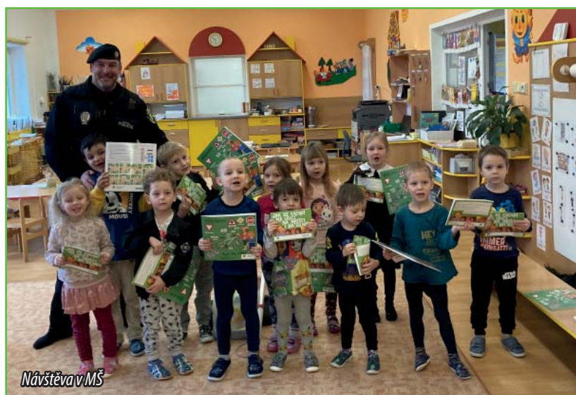
Návštěva v MŠ