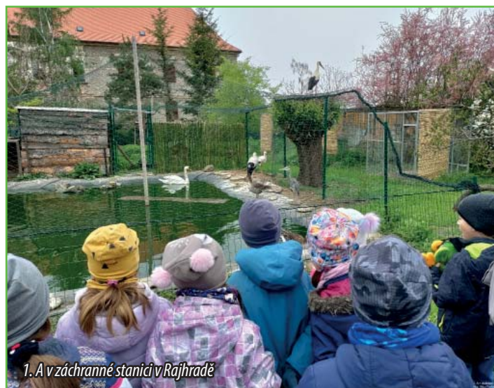
1. A v záchraně stanic v Rajhradě

K příležitosti Dne Země jsme navštívili záchranou stanic v Rajhradě a dozvěděli se, jak se správně postarat o opuštěná nebo zraněná zvířata. Víte, že ptačí mláďata, která najdete na zemi, máte vzít do ruky a posadit na větev, ale že na mláďata savců v přírodě sahat nemáte? Věděli jste, že čáp sní denně množství potravy odpovídající dvaceti hrabošům a že orli žijí až osmdesát let? My už ano. K tomu jsme zvládli podle mapy dojít k rybníku Šejba a udělat jarní průzkum přírody. Seznámili jsme se s upcyclací a podělili se o nápady, jak můžeme šetřit vodou a k čemu je dobré třídit odpady.