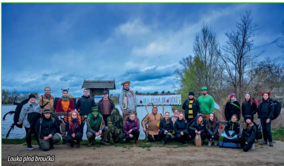
Louka plná broučků

V sobotu 23. 3. 2024 se konala akce Louka plná broučků. Tak jako každý rok, okolo rybníku Šejba. Letošní počasí nám přálo a obešlo se bez deště, ale zima provázela cestou všechny děti s rodiči, kteří se rozhodli společně s námi akce zúčastnit a přivítat jaro. Na děti čekalo na trase několik disciplín, jako např. házení kroužků na kůly, balancovník, lanové překážky a mnohé další. U každé disciplíny hlídal zodpovědný brouček. Za splnění úkolů děti získávaly části obrázků, které na konci trasy složily. Za odměnu mohly vzbudit broučka s lucernou a smlsnout si na sladké odměně nebo se zahřát u ohně a péct si špekáček.