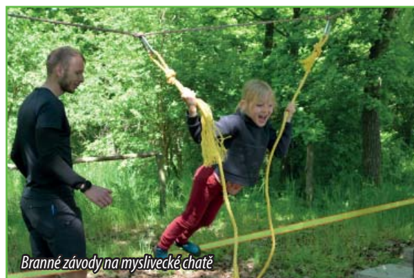
Branné závody na myslivecké chatě

sely děti cestou mezi stanovišti zapisovat. Avšak děti se s trasou i stanovišti popraly, jak nejlépe dovedly. Na konci trasy si mohly vyzkoušet oblíbenou střelbu ze vzduchovky, občerstvit se a pobavit u ohně s opékáním špekáčků. Ty nejlepší hlídky byly řádně odměněny na závěrečném vyhlášení. Tak za rok zase na viděnou!